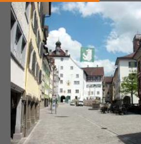
Auf dem Marktplatz