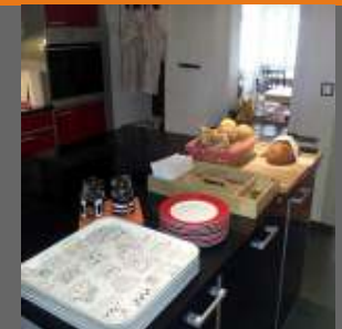
Kochinsel mit aufgetischem Buffet

Wir verfügen über 4 stilvolle und große Doppelzimmer, jedes mit Dusche und Toilette, (auch Einzelbelegung)